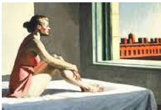
Morning Sun , Edward Hopper, 1952